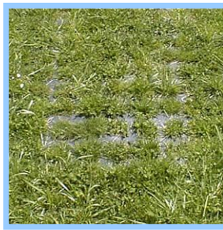
Gras wächst durch die Platten nach

Weitere Informationen hierzu erhalten Sie unter: