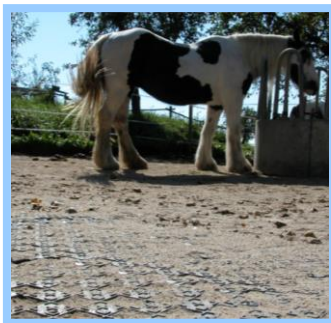
Weicher Untergrund wird zu stabilem Boden